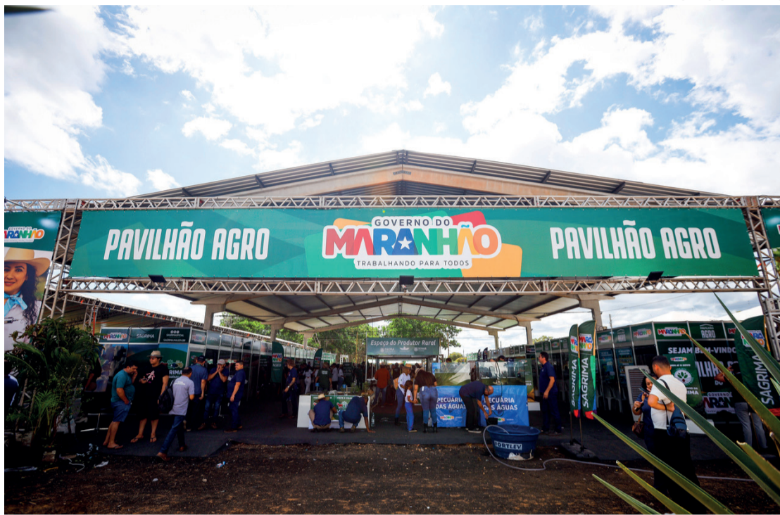
O Pavilhão Agro é um dos espaços do governo do Maranhão na Agrobalsas 2026

também receberá atenção especial do governo do Maranhão por meio do estande da Secretaria de Estado da Agricultura Familiar (SAF). Durante a programação, a SAF promoverá a Feira da Agricultura Familiar, das 17h às 22h, reunindo agricultores familiares para a comercialização de produtos locais, alimentos saudáveis, artesanato e derivados da produção rural. A iniciativa incentiva a geração de renda e o fortalecimento da economia local.